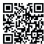
Erwin Schneider Landrat

Hier geht's direkt zur Abfall-App des Landkreises Altötting: